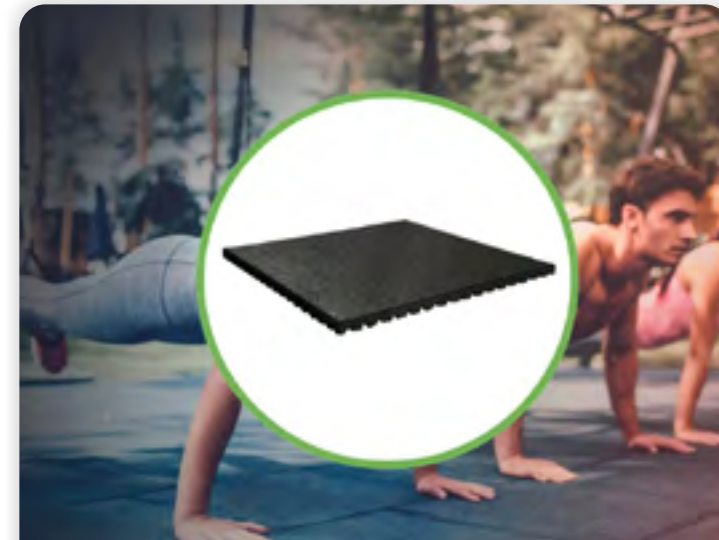
GREENMATTER RELIFE® FITFLEX TEGEL