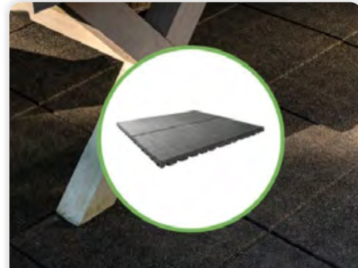
GREENMATTER RELIFE® MULTIDRAIN TEGEL