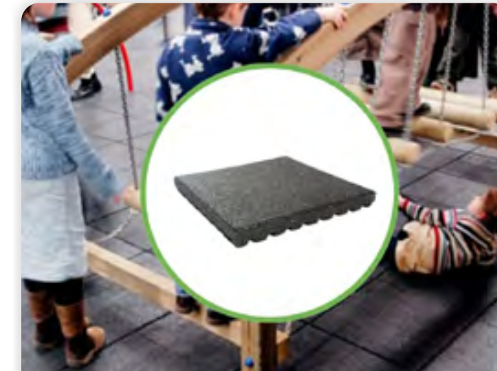
GREENMATTER RELIFE® BASEPLAY TEGEL