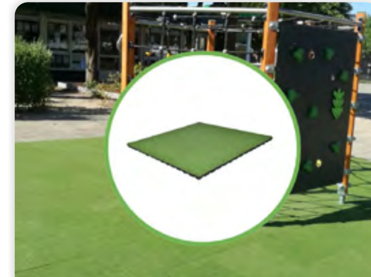
GREENMATTER RELIFE® GRASSPLAY TEGEL