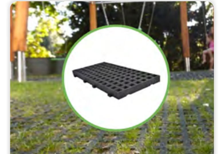
GREENMATTER RELIFE® LAWNPLAY TEGEL